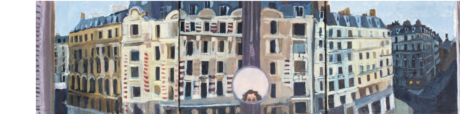
...That is the Question. huile sur toile 2012 65 x82 cm