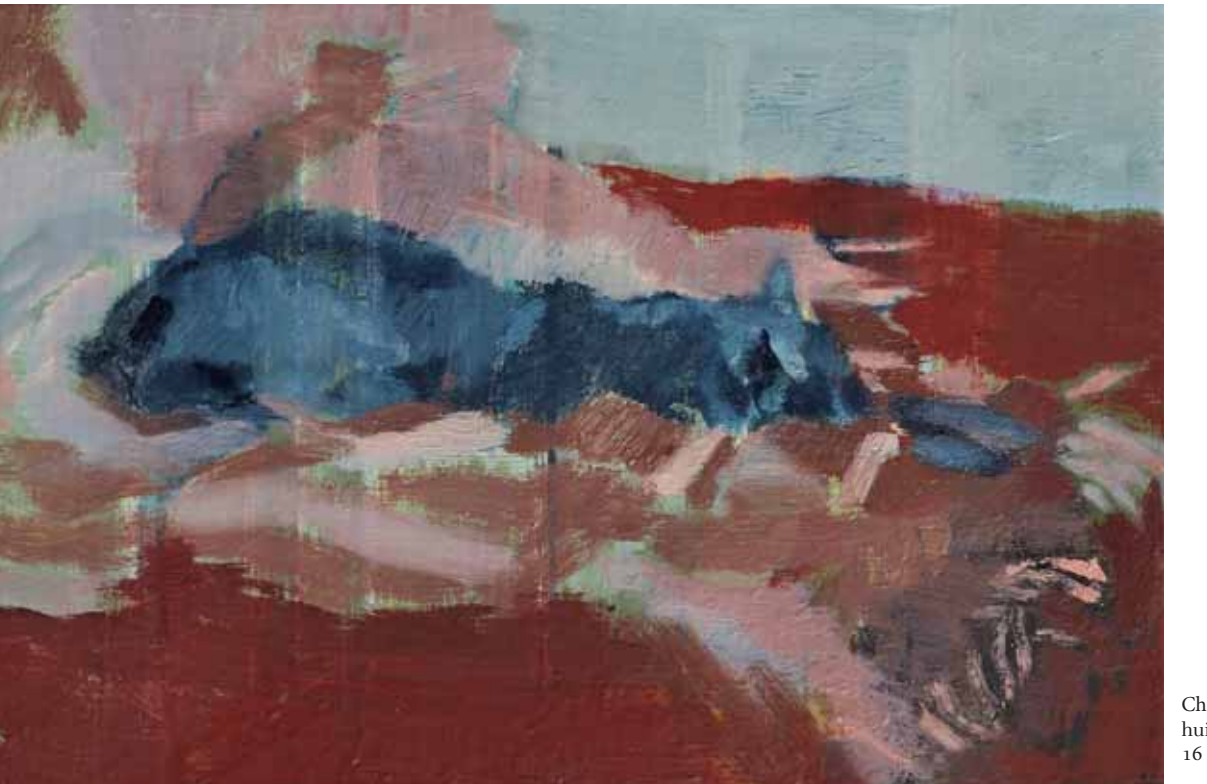
Chaussette ou harmonie rouge huile sur toile 2012 16 x24 cm