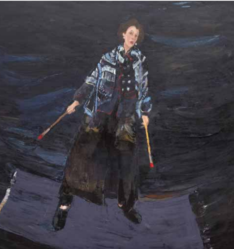
Radeau II huile sur toile 2012 130x130 cm