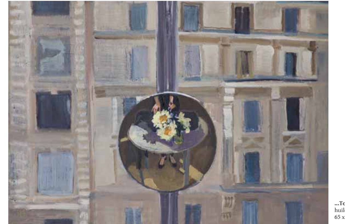
...To be... huile sur toile 2012 65 x92 cm